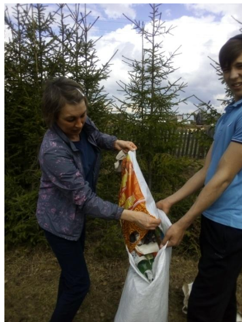
«Раздельный сбор домашних отходов»