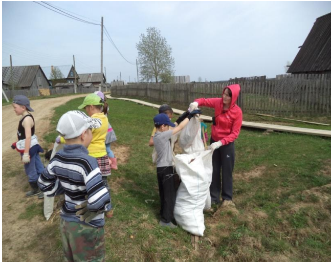
«Чистый посёлок. Чистая улица. Чистый двор»