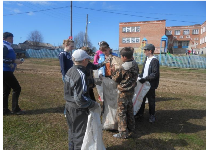
«Родному посёлку чистое лицо»