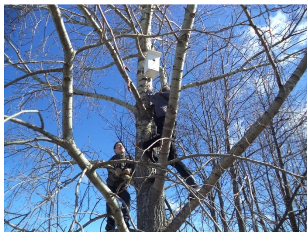
Операция «Весенний скворечник» (Изготовление и развешивание дуплянок и скворечников)