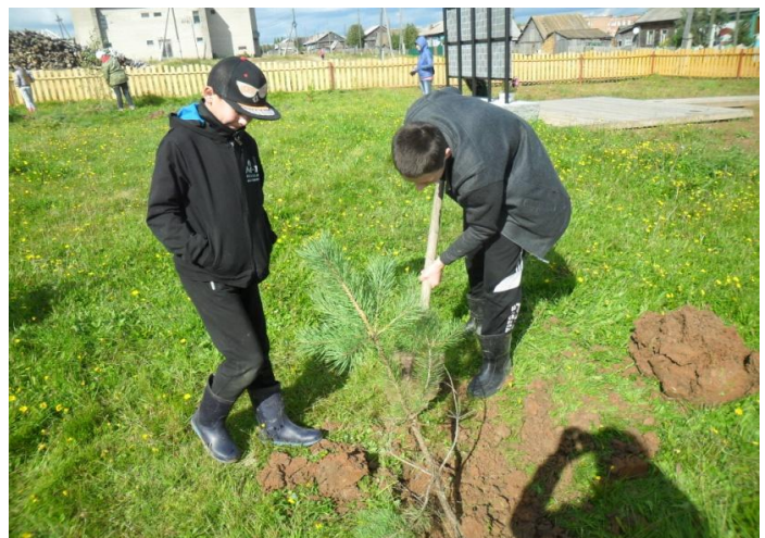
Благоустройство памятных и мемориальных мест