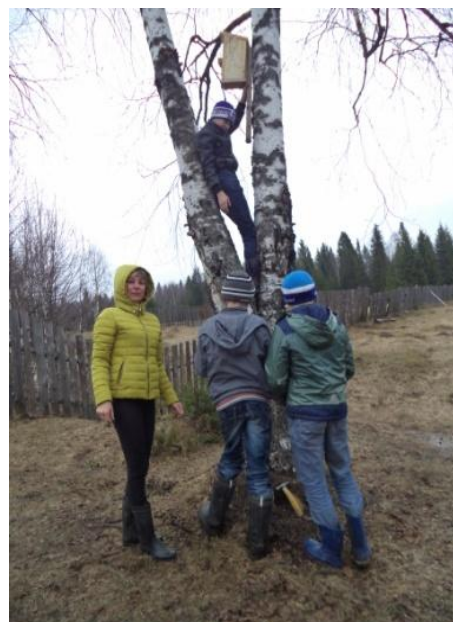
Акция «Встречаем вестников весны»