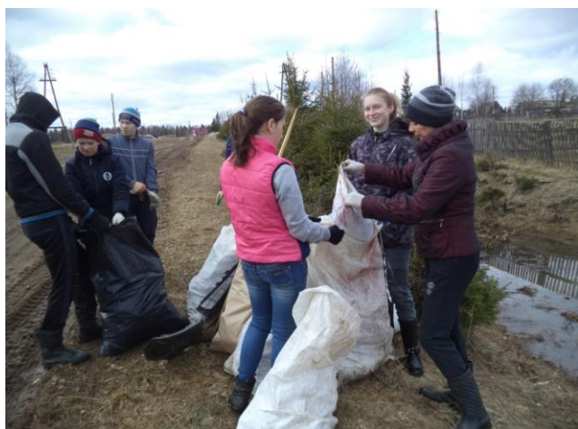
«Очистим планету от мусора»